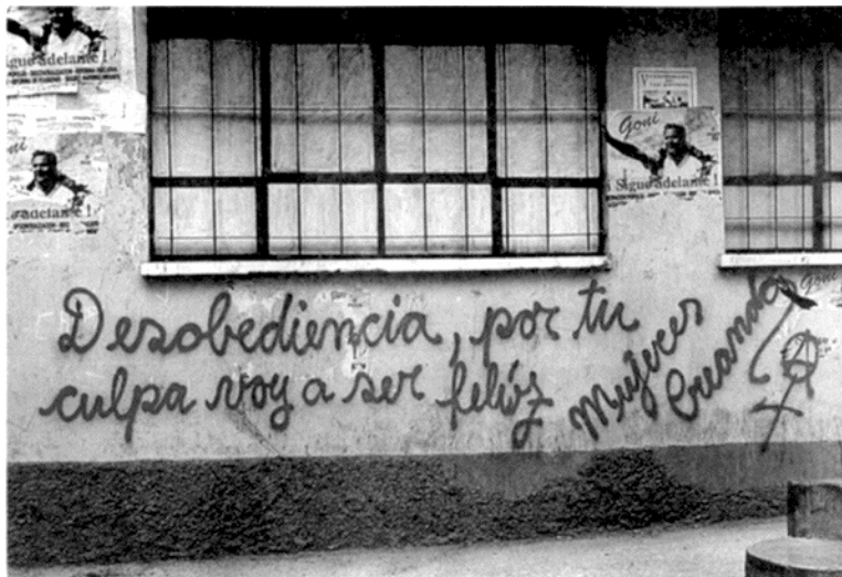
Una de las grafiteadas de Mujeres Creando en una pared que también tiene carteles con la imagen de Gonzalo Sánchez de Losada, actual presidente de Bolivia

Los graffitis de Mujeres Creando no son simplemente una forma de hacer propaganda política o de llamar la atención sobre ciertos temas y sobre ellas mismas. Hay una poética que respalda su creación y su uso. Como ya lo señalamos, las pintadas políticas de los años 80 son el molde inicial de sus graffitis. Pero ellas han señalado que hay diferencias esenciales en la concepción que tienen del grafiti.